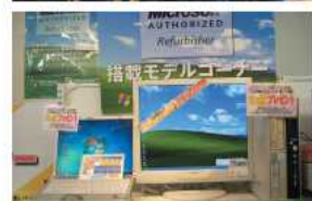
中古PCのデータ消去や動作確認、ライセンスOSのインストールなどは自社工場で行う

はWindows XPもしくはWindows 7。マイクロソフトが提供する各種サービスやソフトウェアを統合した「Windows Live Essentials」もプリインストールされるため、快適に利用することができ、実際にユーザーからの中古PCの信頼度も向上しているという。